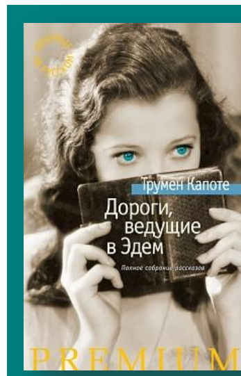
Книги Трумена Капоте в фонде АОНБ